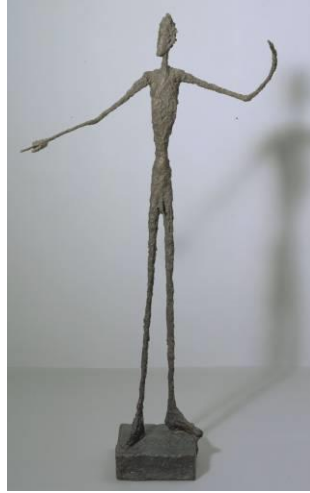
Şekil 6. Alberto Giacometti, "Man Pointing" İşaret Eden Adam Heykeli, 1947. Bronz (178 x 92,5 x 60 cm).

Kübizm ve ilkel sanatla ilgilenen Alberto Giacometti (1877-1960), bilinçli olarak figürlerin bedenlerini inceltmek ve boylarını uzatarak heykeller yaratmıştır. Giacometti'nin (1947) 'Man Pointing' (İşaret Eden Adam) heykeli de incelenerek onun yarattığı heykellerin özelliği görülebilir (Şekil 6). Doğal ölçü ve oranlarında olmayan uzatılmış figürler ile insanın kırılganlığı ve uzun ömürlülüğü anlatmaya çalışmıştır (Şenyapılı, 2003: 68-71). Bu ince, uzun dal gibi figürler ile oluşturduğu 'Orman' heykelinde Giacometti'nin soyutlanmış gölge gibi duran figürleri incelenebilir (Şekil 7) (Lynton, 2009: 195).