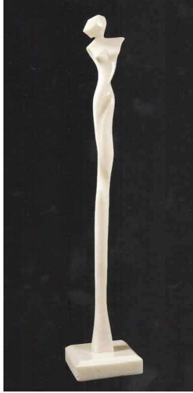
Şekil 2. Tüba İnal, figür heykel. Mermer (36 x 20 x 3 cm) (Tüba İnal Heykel Sergisi: Figürler ve İnsanlar, 2004: 21).

Heykelde malzeme olarak beyaz renkli mermer kullanılmıştır. Heykelin boyutları, 53 x 3 x 3 cmdir. Malzemenin sertlik, yontulabilirlik gibi fiziksel özellikleri ve dokusu heykelin biçimlenmesini etkiler. Mermer taşından eser oluşturmada; yontma, oyma, zımparalama ve cilalama gibi teknikler kullanır.