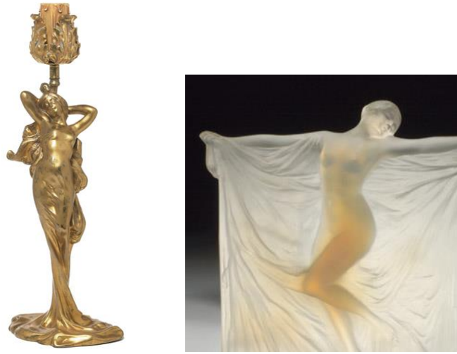
Şekil 8. Art Nouveau lamba altlığı. Bronz üzeri altın yaldızlı patine (39,4 cm) (Url-2); Art Nouveau heykel. Cam (Url-3).

Estetik anlamda Art Nouveau'nun taşıdığı organik, akışkan, kıvrak, kadınsı (feminen) çizgilerin etkisini heykelde görebiliyoruz. Ama Tüba İnal'in bu heykelinin, Art Nouveau'dan ayrıldığı nokta figürü bütün ayrıntılarıyla vermek yerine onu soyutlularak anlatmasıdır. Aşağıda yer alan Art Nouveau heykellerini incelediğimizde kadının saç, yüz, beden, elbise gibi her detayı incelikle işlenerek verildiğini görülmektedir (Url-2 ve Url-3) (Şekil 8). Oysa bu heykel gerek boyutları gerekse anlatımı yönüyle kendi özgünlüğünü ortaya koyar ve sadece bir feminen heykel olarak değerlendirilemez. Çünkü Tüba İnal, insana odaklanıp onu anlatmaya çalışırken kendi bedenini iyi tanıdığı için kadın figürünü kullanmıştır.