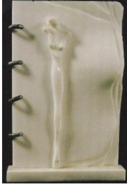
Şekil 1. Tûba İnal, figür heykel. Mermer (36 x 20 x 3 cm) (Tûba İnal Heykel Sergisi: Figürler ve İnsanlar, 2004: 21).

Tûba İnal’ın figür heykeli, sanatçının 14. Sergisi olan Figürler ve Sayfalar Sergisi ’nin bir parçasıdır ve bu sergi 2004’te Kare Sanat Galerisi’nde gerçekleşmiştir. Sergi, sanatçının mermer rölyef çalışmalarından oluşmaktadır. ‘Figürler’, insanı duygu ve düşünceleriyle anlamaya yöneltir ve gerçek hayatta insanın iç dünyasına bakmasına ve sorgulamasına fırsat verir. Figür heykeller, düş ile yaşamı birleştirir. ‘Sayfalar’, sanatçının defterindeki eskiz çalışmalarının mermerde üç boyutlu canlandırılmasını hissettirir. Sayfa boyutu, sayfa üzerinden figürleri okumayı vurgular ve aşağıdaki şekil üzerinden sergideki figürün sayfada kullanım örneği incelenebilir (Tûba İnal Heykel Sergisi: Figürler ve İnsanlar, 2004: 21) (Şekil 1).