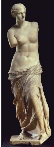
Şekil 4. Tûba İnal, “Güneşin Doğuşu” Heykeli (Tûba İnal: Kısas-1 Enbiya'dan Alıntılar, 1997).

Milo Venüsü, Yunan heykellerinin özelliği olan tabiat gerçekçiliğini ayrıntılarıyla yansıtır. Oysa Tûba İnal'in heykelinde figür birebir tabiat gerçekçiliğinden, ayrıntılardan uzaktır ve kompozisyon olarak saf ve soyut bir dille anlatılmaktadır. Heykellerin ortak noktası kadın figürlere sahip olmaları ve omuzlarda torso kullanılmasıdır.