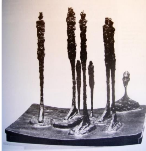
Şekil 7. Alberto Giacometti, Orman, 1950. Bronz (58 x 64,5 x 60 cm) (Lynton, 2009: 195).

Giacometti'nin bronz heykelleri ile Tûba İnal'in mermer figür heykeli beraber incelendiğinde figür heykellerin biçimsel açıdan ince uzun olmasına karşın Tûba İnal'in heykelinde ruhu ve düşüncüyü anlatış üslubuyla Giacometti'nin uzun ömürlülüğü ve kırılganlığıyla anlattığı insanların ne kadar farklı olduğu görülmektedir. Her eser, sanatçısının elinde oldukça farklı şekilde biçim almıştır ve farklı anlamlarla yüklüdür.