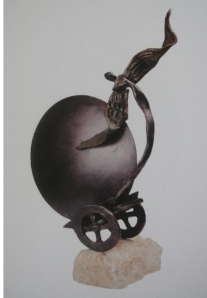
Şekil 3. Tüba İnal, “Güneşin Doğuşu” Heykeli (Tüba İnal: Kıyas-ı Enbiya'dan Alıntılar, 1997).

Mermer heykeldeki figürün, bacak kısmının normalden uzun oranlı yapılıp ayak detaylarının kaybolması ve ayaklardan spiral olarak dönme hareketi ile ruhsal bir yükseliş hissedilir. Bu ruhsal yükselişte düşsel ve imgesel bir uçuculuk sezilir. Heykel biçim olarak incelendiğinde, insan bedeni hem anatomik oransallıktan hem de fiziksel detaylardan arınıp uzaklaşmış ve soyut bir figürü temsil eden kendi içinde dengeli bir kompozisyona dönüşmüştür. Heykelin boynunun yana yatık duruşu düşünen bir insanı anlatıyor gibidir.